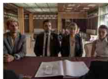
Housekeeping for Beginners.

—El cinema sembla les llavors d'una època determinada amb les nostres històries, que posteriorment