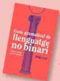
Guia gramatical de llenguatge no binari de d. a. publicada per Raig Verd, 2023.