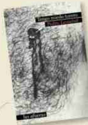
Tengo miedo torero de Pedro Lemebel editat per Las Atenas editorial, 2021.

la Loca que li guardi unes caixes amb llibres en el seu pis. Ella accedeix, fingint credulitat davant el seu contingut.