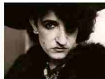
Documental Ocaña, retrato intermitente.

—Ens agradaria que el FireLab pugui créixer no només a llargmetratges de ficció sinó a sèries. Ara hi haurà sis llargs de ficció més quatre projectes de sèries, i així hi haurà més impacte sobre la creació a Catalunya. En definitiva, volem tenir més públic generalista, no només LGTBIQ+, perquè som un festival molt obert a la societat en general, per això es fa la secció Amors on fire al CCCB o aliances amb Casa Asia. Cal arribar a tota la societat per tenir un major impacte i així fer entendre millor la realitat del col·lectiu LGTBIQ+, i el cinema és una magnífica eina per a fer-ho.