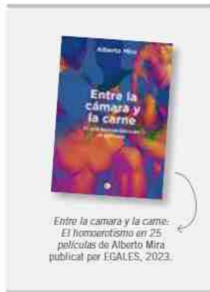
Entre la cámara y la carne. El homoerotismo en 25 películas de Alberto Mira. publicat per EGALES, 2023.

Totes les narratives estan històricament marcades per una diferència de classe o d'edat, i s'aprofiten aquestes estructures de classe. Un cos proletari és un cos desitjable perquè té menys recursos que el senyor que ho desitja. El treballador amb músculs com a objecte de desig. Està en Fribank, o en Chirbes. De vegades aquests cossos de terra ajuden l'home burgès de sortir del seu aburguesament.