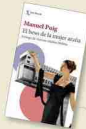
El beso de la mujer araña de Manuel Puig editat per Booket, 2023.