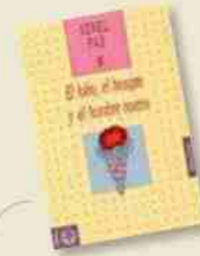
El lobo, el bosque y el hombre nuevo de Senel Paz publicat per Ediciones Era, 2005.

A diferència de les novel·les, Diego no qüestiona el gènere, però sí planteja el desig com una pulsio ingovernable, ja sigui cap al sexe, el plaer o el coneixement. Per aquesta naturalesa, el desig és el primer que vol sufocar un sistema totalitari, per més revolucionari que sigui. Basta veure el discurs i el mecanisme que opera en els companys d'en David. Gràcies al seu punt de vista, és recognoscible el conflicte intern del revolucionari: per què s'exclou la diversitat sexual? En 2001, apareixen la Loca del Frente i en Carlos, escrits pel Lemebel. Desconeixem els seus noms. El primer és un sobrenom amb el qual la comunitat ha etiquetat un dels seus membres i el segon és el pseudònim que el revolucionari emprava com a mecanisme d'ocultació de la seva identitat, imprescindible si vol participar amb èxit en atemptat contra el dictador Pinochet (un fet de 1986, que va ocórrer en la realitat i va inspirar a l'autor). Els personatges es relacionen perquè en Carlos demana de favor a