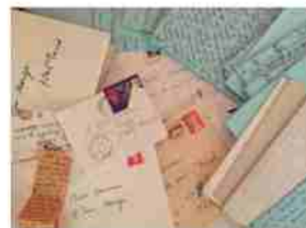
Fragments of a Life Loved.